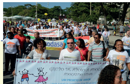
Ato na Praia de Copacabana pede agilidade na adoção de crianças e adolescentes que vivem em abrigos.

Os participantes chamam atenção para adoção de crianças mais velhas.